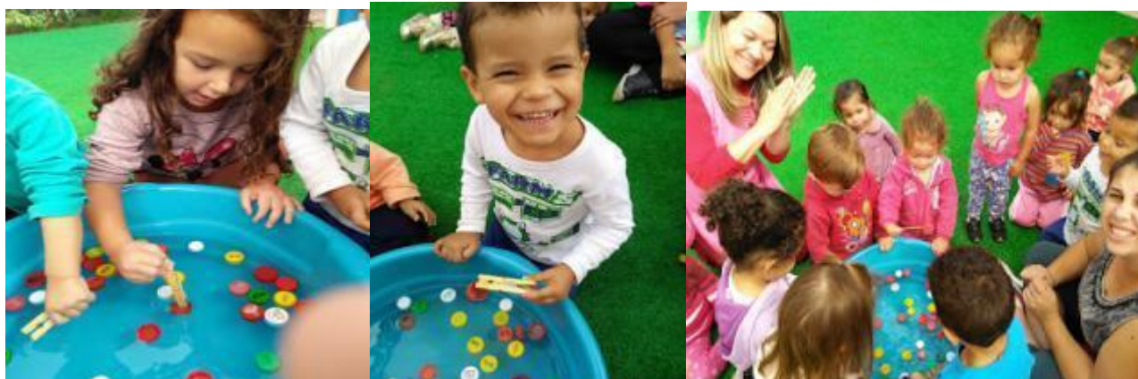
Imagens da atividade.