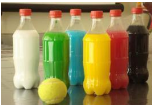
Imagem da atividade.

METODOLOGIA: Para essa atividade será necessárias três garrafas pet, uma bola e papéis das cores AZUL, VERMELHO E AMARELO. Cole os papéis um em cada garrafa, coloque um do lado do outro e peça que a criança jogue a bola na direção das garrafas, quando ela conseguir derrubar uma garrafa, pergunte para a mesma se ela reconhece a cor que foi derrubada. Repita várias vezes, para que a criança consiga identificar alguma das cores. O boliche faz com que a criança percebe que é capaz de aprender, operações matemáticas, noção de espaço, coordenação motora e o raciocínio lógico.