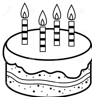
Imagem da atividade.